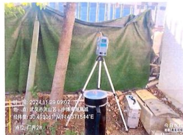
厂界 2# (O2) 无组织排放废气监测点