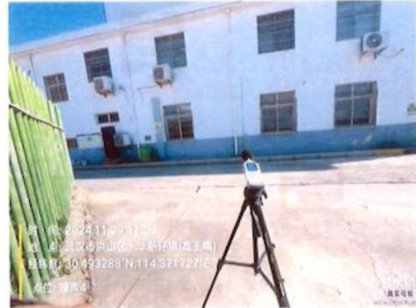
厂界 4# (▲4) 噪声监测