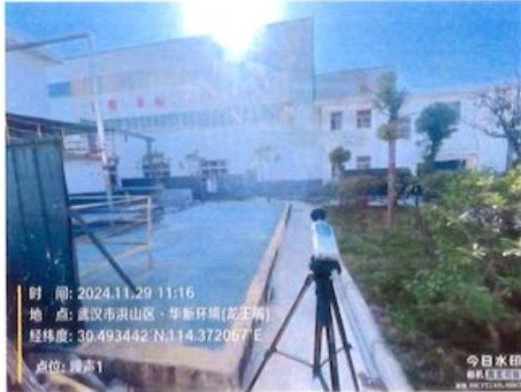
厂界 1# (▲1) 噪声监测