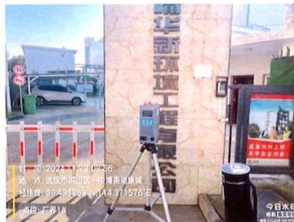
厂界 1# (O1) 无组织排放废气监测点