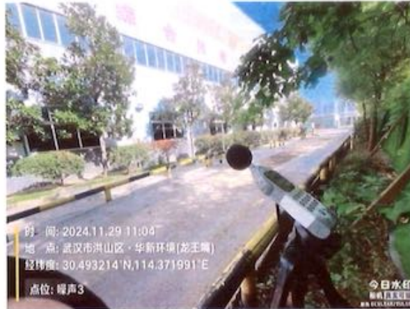
厂界 3# (▲3) 噪声监测