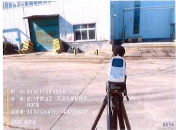
厂界 2# (▲2) 噪声监测