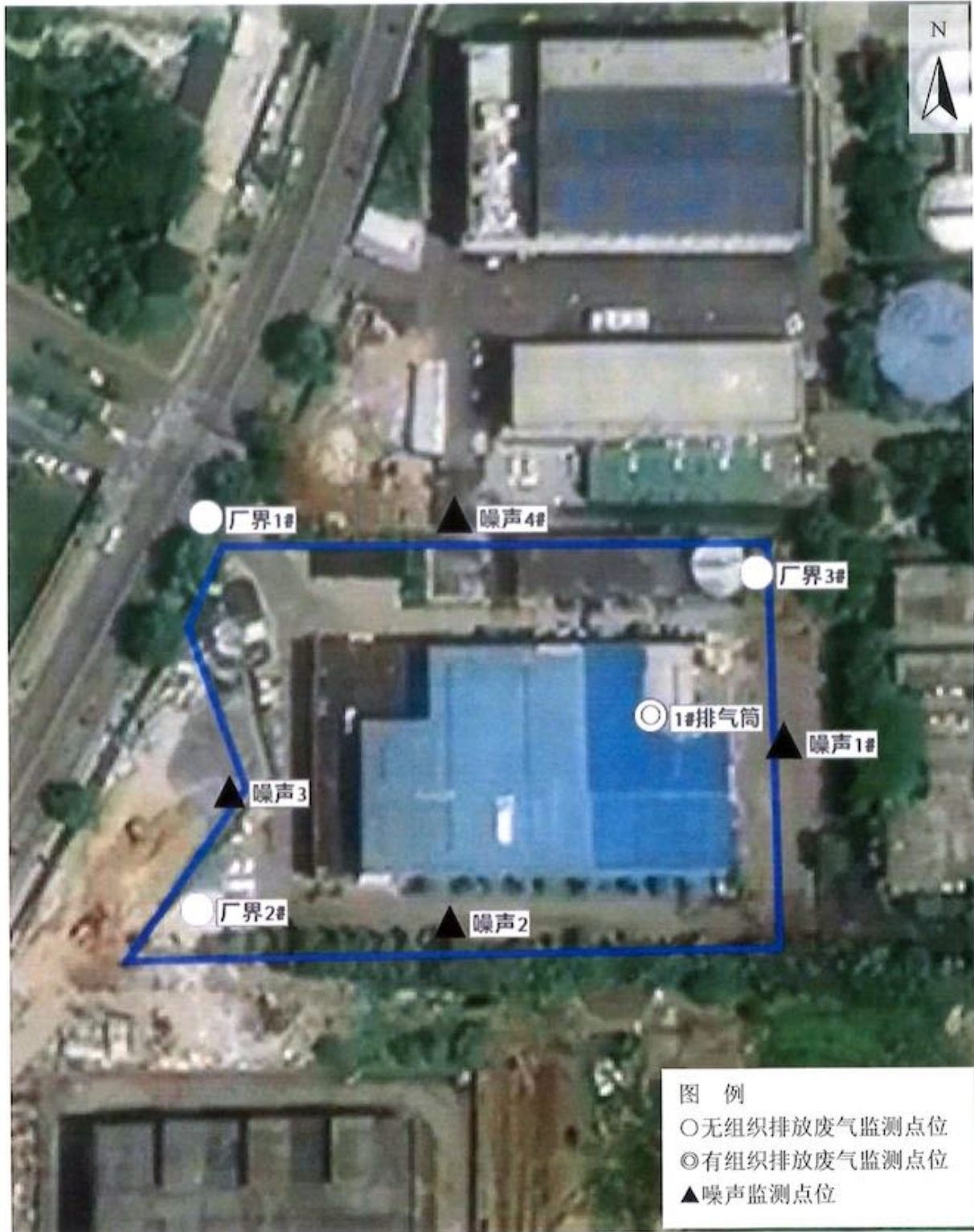
附图 1：监测点位示意图