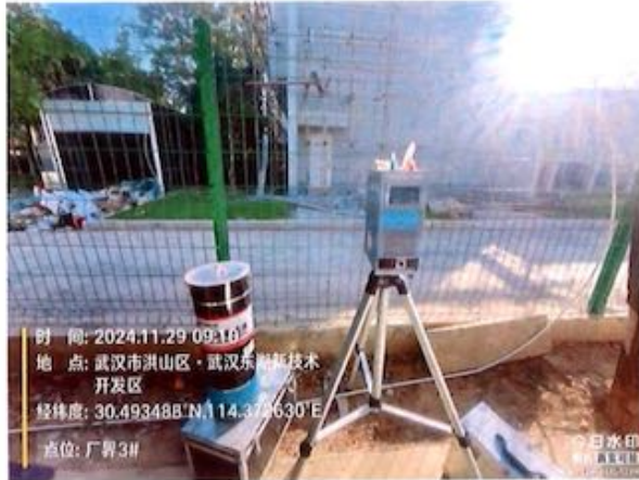
厂界 3# (O3) 无组织排放废气监测点